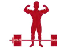
De kracht van stad en land

In de Omgevingsvisie 2040 schetst de gemeente een inspirerend beeld van een stad die zich blijft ontwikkelen, met oog voor duurzaamheid, leefbaarheid en innovatie. De visie biedt een richtinggevend kader voor de fysieke leefomgeving en verbindt belangrijke thema's zoals wonen, economie, mobiliteit, energie, water, landschap, natuur, cultureel erfgoed en sociale ontwikkelingen.