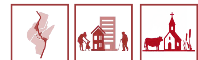
Drie gebiedsgerichte ambities